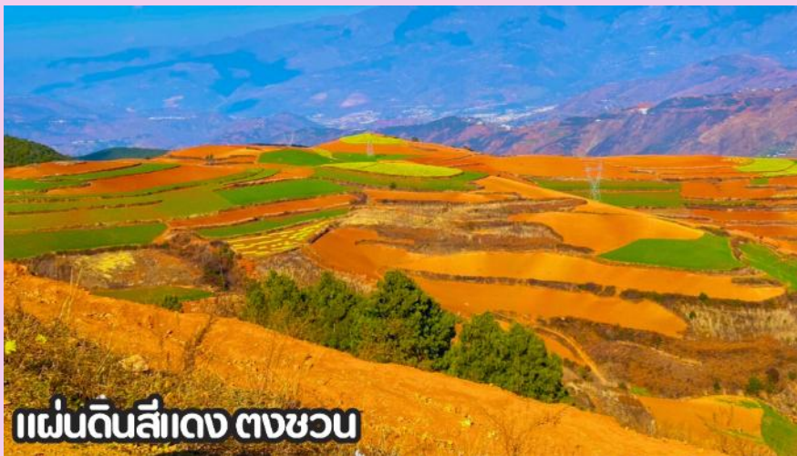
แผ่นดินสีแดง ตงชวน

นำทุกท่านเดินทางสู่ เมืองตงชวน (DONGCHUAN) หรือที่รู้จักกันในชื่อ หงกู่ตี้ ซึ่งแปลว่าแผ่นดินสีแดง เมืองตงชวนตั้งอยู่ทางทิศตะวันออกเฉียงเหนือของมณฑลยูนหนาน มีภูมิประเทศเป็นทิวเขาสลับซับซ้อน ชาวพื้นเมืองส่วนใหญ่ประกอบอาชีพปลูกข้าวสาลี มันสำปะหลัง ผักต่างๆ และดอกไม้บานาพันธุ์ และตงชวน ยังถือว่าเป็นจุดท่องเที่ยวไฮไลต์อีกหนึ่งแห่งของคุนหมิง เป็นจุดที่นักท่องเที่ยวนิยมแวะมาเก็บภาพบรรยากาศที่สวยงาม นำท่านชม ภูเขาเจ็ดสีแห่งตงชวน หรือ แผ่นดินสีแดง (DONGCHUAN RED LAND) ตั้งอยู่ในเขตเมืองตงชวน ทางตอนเหนือของคุนหมิง มีภูมิประเทศเป็นทิวเขาสลับซับซ้อนและ