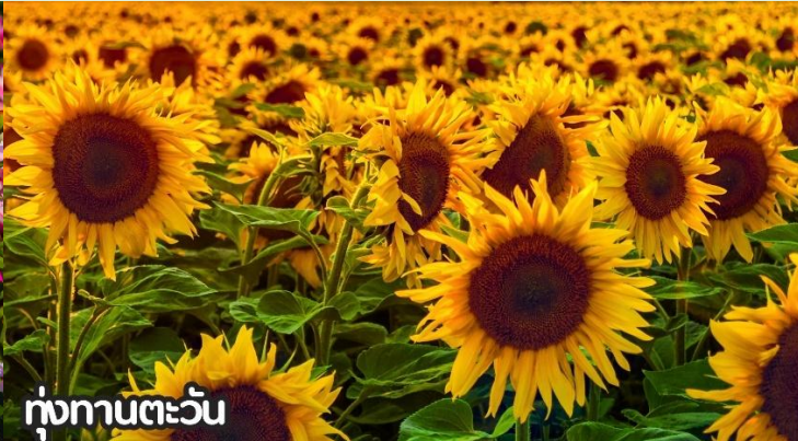
ทุ่งทานตะวัน

จากนั้นนำท่านสู่ถนนหวังฝู่จิ้งถนนคนเดินสุดฮิตใจกลางกรุงปักกิ่ง ปัจจุบันถนนนี้เป็นที่นิยมมากในหมู่นักช้อปปิ้งและนักท่องเที่ยวที่ตบเท้าเข้ามาเพื่อเสาะหาของลดราคาและเสื้อผ้าที่มีเอกลักษณ์ไม่ซ้ำใคร ถนนการค้าที่พลุกพล่านแห่งนี้มีมีม้านั่ง บาร์ ร้านอาหาร