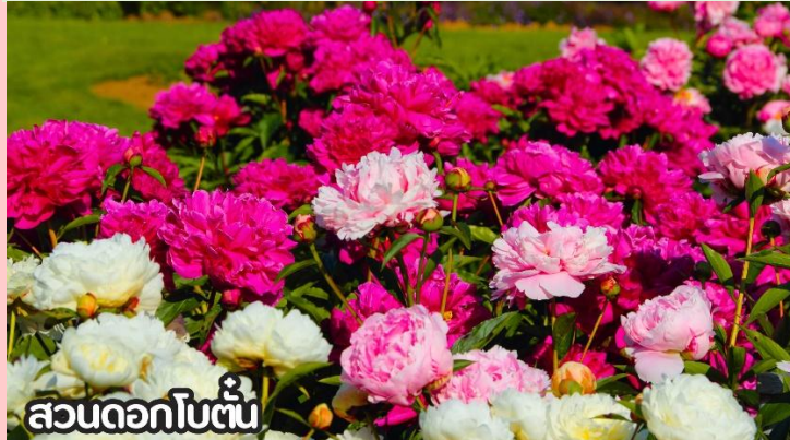
สวนดอกโบตั๋น

ดอกทานตะวันในปักกิ่งบานสะพรั่งสวยงามในหลายพื้นที่ โดยเฉพาะช่วงฤดูร้อนที่สวนป่าโอลิมปิก (Olympic Forest Park) และสวนสาธารณะริมแม่น้ำหยุนหยวน (Wenyu River Park) กลายเป็นจุดชมวิวยอดนิยมที่ดึงดูดนักท่องเที่ยวให้มาถ่ายรูปกับทุ่งดอกสีเหลืองอร่าม เป็นสัญลักษณ์ของฤดูร้อนที่สดใสของเมืองหลวงจีน เดือนสิงหาคม-ต้นกันยายน ชมทุ่งดอกเบญจมาศหรือดอกไฮเดรนเยีย ดอกเบญจมาศปักกิ่งหมายถึงสายพันธุ์เบญจมาศที่มีต้นกำเนิดหรือนิยมปลูกในกรุงปักกิ่ง ประเทศจีน โดยเฉพาะช่วงฤดูใบไม้ร่วง ที่มีการจัดงานมหกรรมดอกเบญจมาศ แสดงความหลากหลายของสีและรูปร่าง มีสายพันธุ์เช่น "กุส่วยจินเสี" ที่ได้รับรางวัลราชาดอกเบญจมาศ และยังมีเบญจมาศปักกิ่งสีขาวที่เป็นสมุนไพรด้วย ที่สำคัญคือเป็นดอกไม้ที่ใช้ในงานเทศกาลและวัฒนธรรม โดยเฉพาะในสวนสาธารณะ เช่น รือถาน และอุทยานเป่ย์ไห่ มีหลากหลายสี เช่น ขาว เหลือง ชมพู แดง และม่วง สามารถพบได้ในหลายพื้นที่