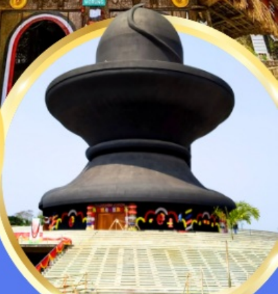
วันมหาฤตยูชัย