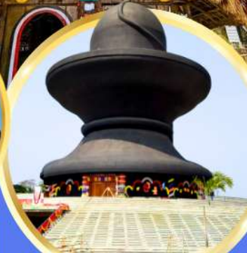
วัดมหาฤตยูชัย