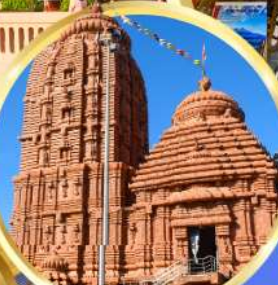
เทวาลัยศรีจักรนารท แห่งดีบุรกาห์