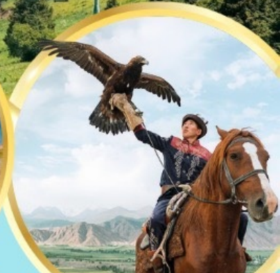
ชมโซว์นกอินทรี