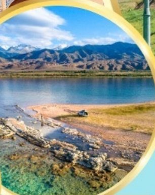
ล่องเรือทะเลสาบอิสซิค