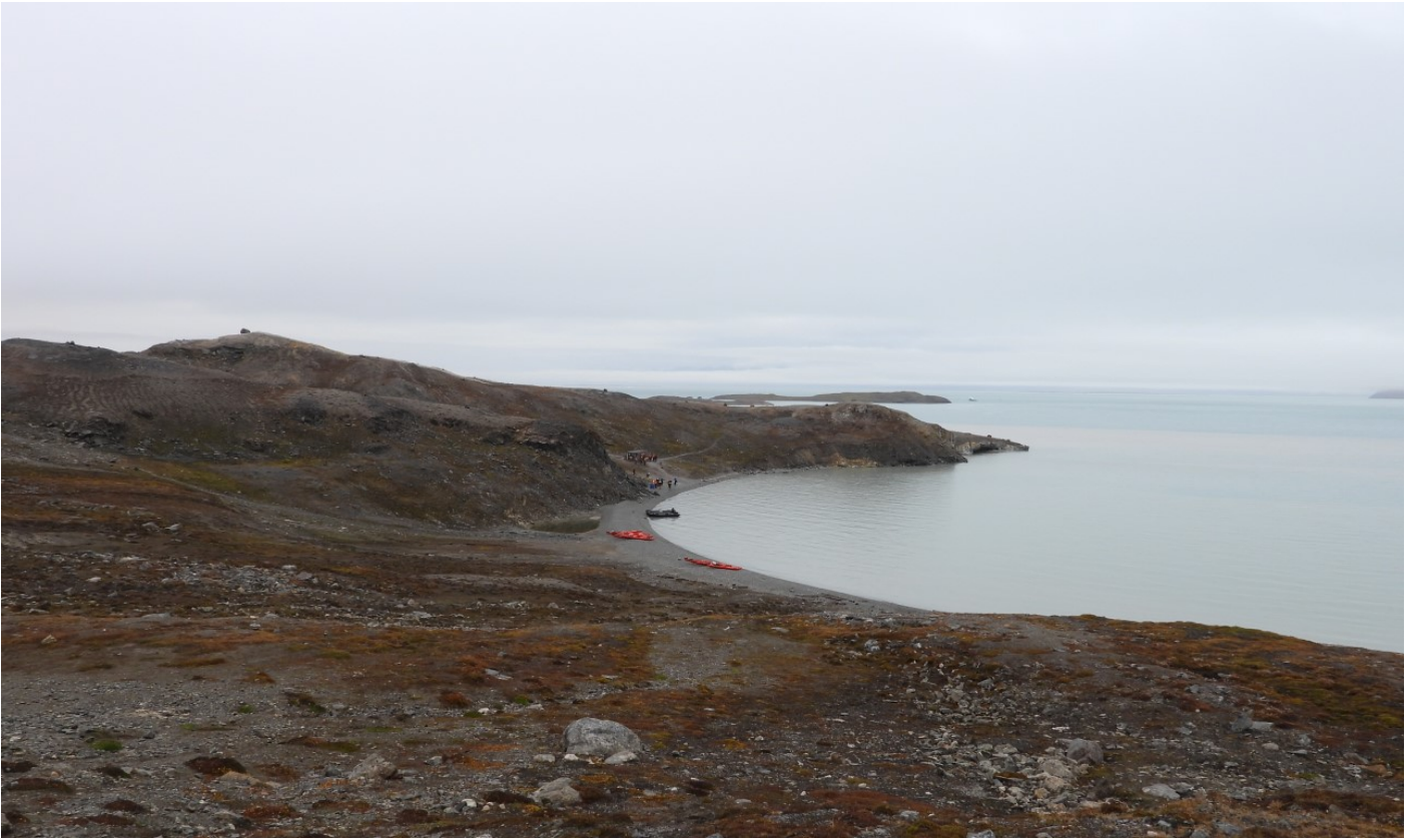
เขตอนุรักษ์ธรรมชาติซอร์อูสท์ (Soraust Svalbard Nature Reserve)

เป็นเกาะขนาดเล็กทางตอนเหนือของสวาลบาร์ด มีพื้นที่เนินเขาเตี้ยๆและอยู่ใกล้กับธารน้ำแข็งทางตอนเหนือของสวาลบาร์ดอีกด้วย ที่นี่ได้รับการขนานนามว่า อ่าวแห่งรัก (Love Bay) ท่านจะได้ชื่นชมทัศนียภาพและความสวยงามของอ่าว รวมถึงสัตว์ไม่ว่าจะเป็นหมีขาว แมวน้ำ ที่มีถิ่นอาศัยในบริเวณนี้เช่นกัน