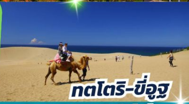
ทตโตริ-ซึอูซุ