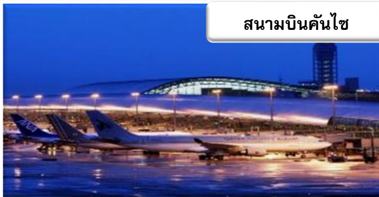
สนามบินคันไซ

00.25 น. ออกเดินทางสู่ สนามบินคันไซ ประเทศญี่ปุ่น โดยสายการบินเจแปนแอร์ไลน์ เที่ยวบินที่ JL 728