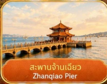
สะพานจันเจียว Zhanqiao Pier