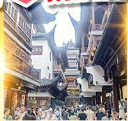
เจียงหวงเมี่ยว