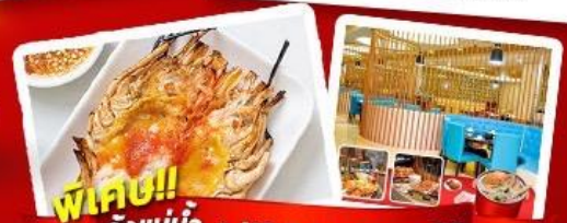
พิเศษ!! ก๊วยแม่น้ำ + HOTPOT SEAFOOD