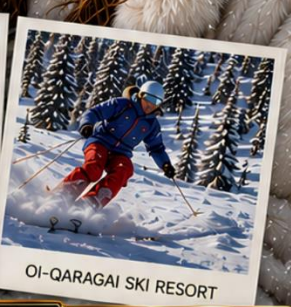
OI-QARAGAI SKI RESORT