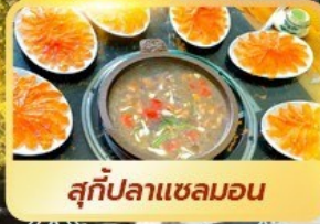
สุกี้ปลาแซลมอน