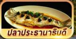
ปลาประรานาภิรมดี