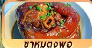
ชาหมูตงพอ