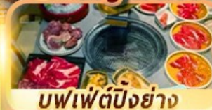
บุฟเฟ่ต์ปิ้งย่าง