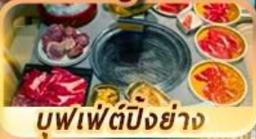
บุฟเฟ่ต์ปักกิ่งย่าง