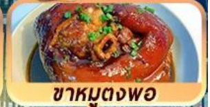
ชาหมูตงพอ