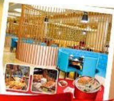
กึ่งแม่น้ำ + HOTPOT SEAFOOD