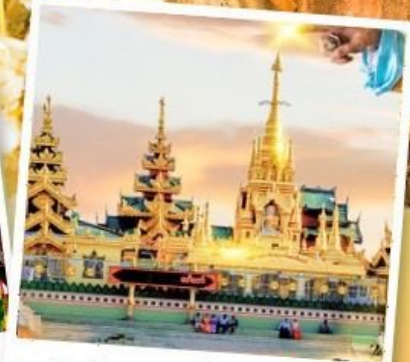
เจดีย์กลางน้ำ (สิริเยม)