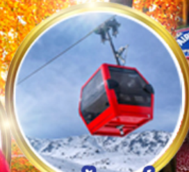
กระเช้ากุลมาร์ค ชมวิวสุดอลังการ