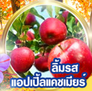
ลิ้มรส แอปเปิ้ลแคชเมียร์