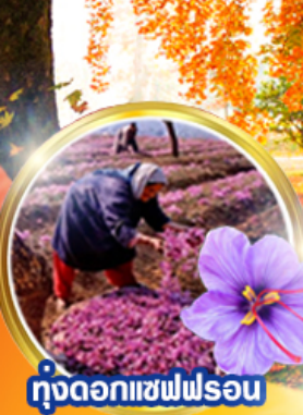
ทุ่งดอกแซฟฟรอน