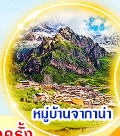
หมู่บ้านจาก่าน่า

หนึ่งปี..มีเพียงหนึ่งครั้ง กับเส้นทางสุดพิเศษ 27 มิ.ย.- 6 ก.ค. 69