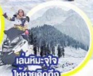
เล่นหิมะ-จ๊อ ไท่หยกคิดถึง