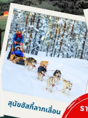
สุนัขฮัสกีลากเลื่อน