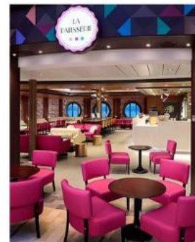
La Patisserie LA PATISSERIE