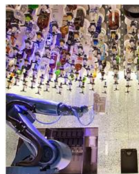
Bionic Bar BIONIC BAR