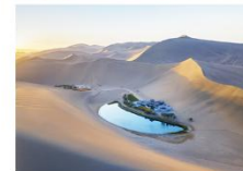
ทะเลทรายหมิงซาซาน ทะเลสาบพระจันทร์เสี้ยว

16.32 น. ออกเดินทางสู่เมืองอู๋หลู่ฟาน ด้วยรถไฟความเร็วสูง ขบวนที่ D55