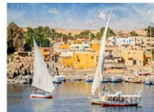
Option ล่องเรือเฟลกะ หรือ ล่องเรือชมหมู่บ้าน Nubian Village

** พักที่ Royal Beau Rivage Nile cruise 5* หรือเทียบเท่า **