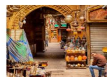
ตลาดชานเอลคาลีลี

20.50 น. ออกเดินทางสู่อิสตันบูล เที่ยวบิน TK695