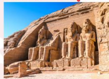
มหาวิหารอาบูซิมเบล