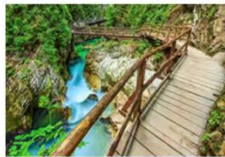
ทิวเขาวินท์การ์จอร์จ

** พักที่ Radisson Blu Plaza Hotel 4* หรือเทียบเท่า **