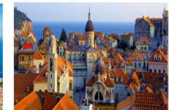
เมืองเก่า

** พักที่ Adria Hotel 4* หรือเทียบเท่า **