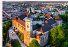
ปราสาทลูบลียานา

** พักที่ Radisson Blu Plaza Hotel 4* หรือเทียบเท่า **