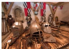
ปราสาทเพรจามา

** พักที่ Radisson Blu Plaza Hotel 4* หรือเทียบเท่า **