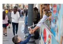
ไอศกรีม Maraş ชมพระอาทิตย์ตกดิน ณ ภูเขาเนมรุต