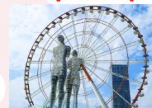
รูปปั้นอาลีและนีโน