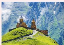
Gergeti sameba church

** พักที่ Intourist Kazbegi Hotel หรือเทียบเท่า **