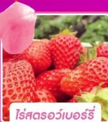
ไร้สตรอว์เบอร์รี่