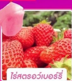
โรสฮอว์เบอร์รี่