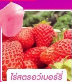
โรสตรอว์เบอร์รี่