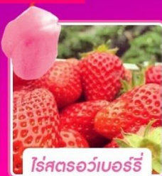
ไรส์โตรว์เบอร์รี่