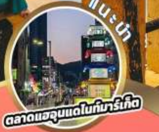
ตลาดแฮอุนแดไนท์มาร์เก็ต