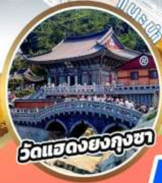
วัดแสดงยงกุงซา