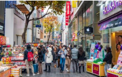
ทางเดินอย่างสวยงาม

ย่านเมียงดง เป็นย่านช้อปปิ้งที่คึกคักอันดับต้นๆ ใจกลางกรุงโซล บริเวณถนนเรียงรายด้วยอาคารร้านค้ามากมายหลายแบรนด์ไม่ว่าจะเป็นเสื้อผ้า กระเป๋า รองเท้า เครื่องสำอาง คาเฟ่ และร้านอาหารหลากหลายประเภท อีกทั้งยังมีแผงสตรีทฟู้ดเกาหลีต่างๆ ให้ได้ลองลิ้มชิมรส ย่านนี้จึงเป็นสถานที่ยอดนิยมของนักท่องเที่ยวและเป็นถนนช้อปปิ้งที่มีชีวิตชีวาเป็นอย่างมาก