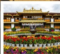
ตำหนักนอร์บูหลินมา

ชมวิวยอดเขานานเจียปาหว่า / จุดชมวิวกะเลปาหลูกลาง / อุทยานเขาเป็นยี่ / ระเบียงกระจก / วัดลามะ พระราชวังโปตาลา / วัดโจคัง / ถนนแปดเหลี่ยม / ทะเลสาบน้ำมูเซว / ตำหนักนอร์บูหลินมา / เมืองโบราณลั่วใต้