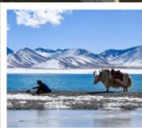
ทะเลสาบน้ำมูเซว