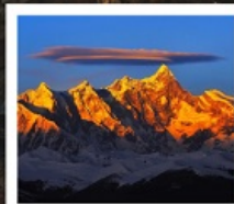
เขานานเจียปาหว่า