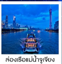
ล่องเรือแม่น้ำจูเจียง

ล่องเรือแม่น้ำจูเจียง / ช้อปปิ้งถนนปักกิ่ง / ช้อปปิ้งถนนซังเซี่ยจิว / วัดไทรหกด่าน / ศาลเจ้าตระกูลเฉิน / ถนนคนเดินหย่งซังฟาง