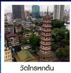
วัดไทรหกด่าน

ทัวร์คุณภาพ ไม่ลงร้านช้อปปิ้ง ไม่ขายออฟชั่น