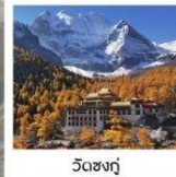
วัดชงกู่