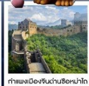
กำแพงเมืองจีนด่านซือหม่าโต