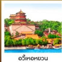
อวี๋เหอหยวน

ลิ้มรสเมนูพิเศษ เปิดปักกิ่ง / สุกี่มองโกล มิซซอลิน TAO TAO JU