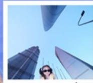
3 ตึกใหญ่แห่งเมืองเซี่ยงไฮ้