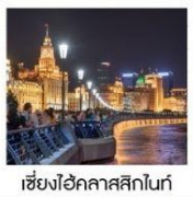
เซี่ยงไฮ้คลาสสิกไนท์