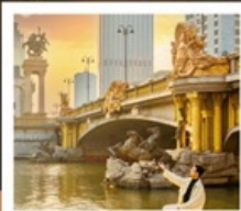
ย่านอิตาลี