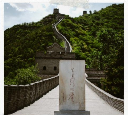
กำแพงเมืองจีน ด่านฉวิหยงกวน