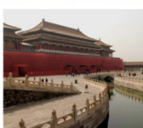
พระราชวังกู้กง