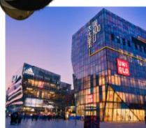
ย่านซานหลี่ตุ่น