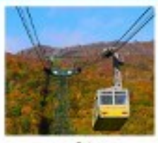
ภูเขาไฟอุสุ