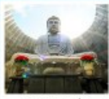
เบบบิเอะพุทธรักษา