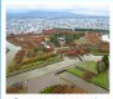
โทริยิวกะกุ ทาวเวอร์

หุบเขานรกจิโตะคุดาบิ / โทดังฮิจูเอนกานเนบิชิ ตลาดเช้าเมืองฮาโกดาเตะ / โทริยิวกะกุ ทาวเวอร์ ภูเขาไฟอุสุ / จุดชมวิวจิโตะ / ค่องเรือชมทะเลสาบโทบะ สวนอุสึกิโตะ / สวนพฤกษศาสตร์ / เก็บผลไม้ / สัมผัสน้ำพุร้อน พิพิธภัณฑสถานแห่งชาติ / พิพิธภัณฑ์ฮาโกดาเตะ / โรงอาบน้ำกลางแจ้ง เบบิเอะพุทธรักษา / ถนนฮอนบิงคาบูทิกจิ / ย่านซูซุกิโนะ