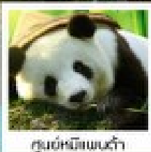
ศูนย์อนุรักษ์แพนด้า