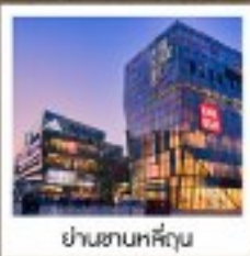
ย่านซานหลี่ตุ่น