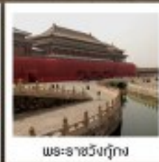
พระราชวังกุ๊กกิง