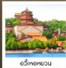
อวี่เหอหยวน