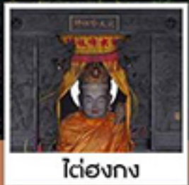
โต๋ฮองกง