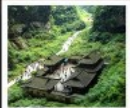
หลุมฟ้า สะพานสวรรค์

พระพุทธรูปทะเลสาบ / หมู่บ้านโบราณเมืองฮงชิ่ง อุทยานหลุมฟ้าสะพานสวรรค์ / ระเบียงกระจก / อุทยานเมฆาหวา ภูเขาโถง / Wulong Flying Kiss / เข็มปักถนนคนเดินเฉิงฟางเฉิง เข็มปักหงหยาดัง / มหาศาลประชาชน / เข็มปักไฟฟ้าทะเลสาบ ถนนโบราณจีนแท้ / ศูนย์หมีแพนด้า