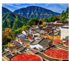
หมู่บ้านหวงหลิ่ง