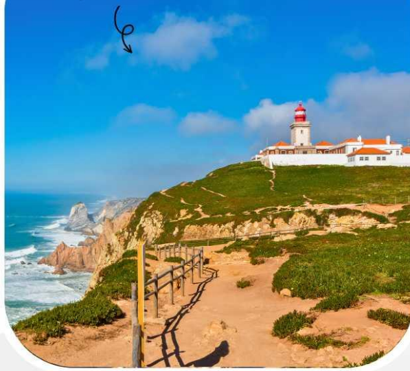
Capo Da Roca