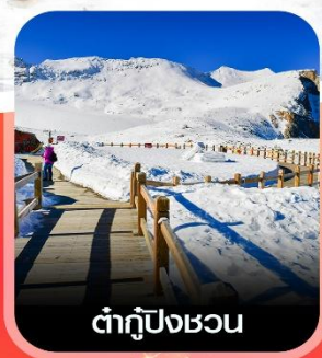
ต่ากู่ปิงชว่น