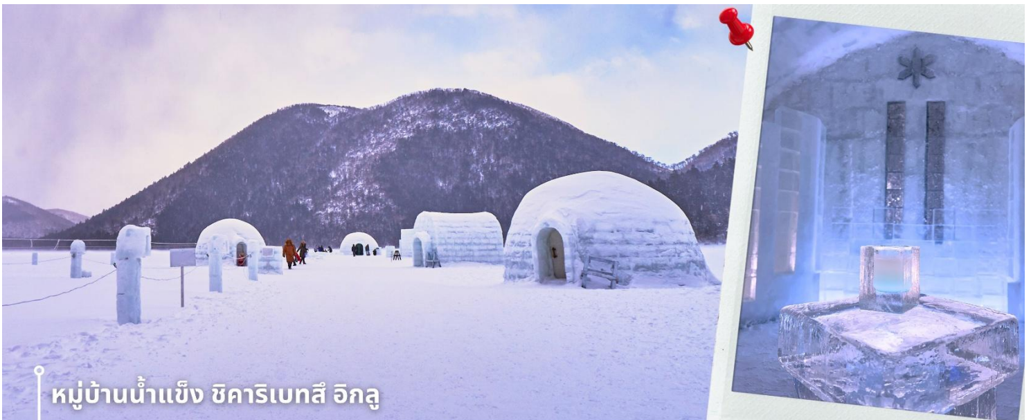
หมู่บ้านน้ำแข็ง ชิคาริเบทสึ อิกุ

เช้า รับประทานอาหารเช้าที่ โรงแรม (4) หลังรับประทานอาหารเช้า นำท่านเดินทางสู่ เมืองซิกาโออิ เพื่อพาท่านสู่ หมู่บ้านน้ำแข็งชิคาริเบทสึ อิกุ อยู่ที่ ทะเลสาบชิคาริเบทสึ (Lake Shikaribetsu) เป็นทะเลสาบธรรมชาติที่ตั้งอยู่ภายในอุทยานแห่งชาติโดเซตสึซัง บน เกาะฮอกไกโด โดดเด่นด้วยธรรมชาติอันเงียบสงบ รายล้อมด้วยภูเขาและผืนป่า พร้อมอากาศหนาวเย็นที่ปกคลุม พื้นที่ในช่วงฤดูหนาว จนกลายเป็นหนึ่งในจุดท่องเที่ยวฤดูหนาวที่มีชื่อเสียงของฮอกไกโด ในช่วงฤดูหนาว บริเวณ ทะเลสาบจะถูกเนรมิตให้กลายเป็น “หมู่บ้านน้ำแข็งชิคาริเบทสึ อิกุ” หรือ Shikaribetsu Kotan หมู่บ้านน้ำแข็งที่ สร้างขึ้นจากหิมะและน้ำแข็งจริงโดยน้ำแข็งจะมีความใสเป็นพิเศษเนื่องจากน้ำในทะเลสาบแห่งนี้ได้ชื่อว่าเป็นน้ำที่ ใสบริสุทธิ์อีกแห่งหนึ่งในฮอกไกโด ภายในงานสามารถเดินชมบ้านอิกุ คาเฟ่ น้ำแข็ง โบสถ์น้ำแข็ง รวมถึงมุมถ่ายรูป สุดสวย สร้างบรรยากาศราวกับเมืองน้ำแข็งกลางหุบเขาหิมะ นอกจากนี้ยังมีกิจกรรมฤดูหนาวหลากหลาย อย่างการ แช่ออนเซ็นกลางแจ้งริมทะเลสาบ (ไม่รวมค่าแช่ออนเซ็น) ท่ามกลางวิวหิมะสีขาวอันเงียบสงบ ถือเป็นอีกหนึ่ง ประสบการณ์ฤดูหนาวอันเป็นเอกลักษณ์ของฮอกไกโดที่ไม่ควรพลาด