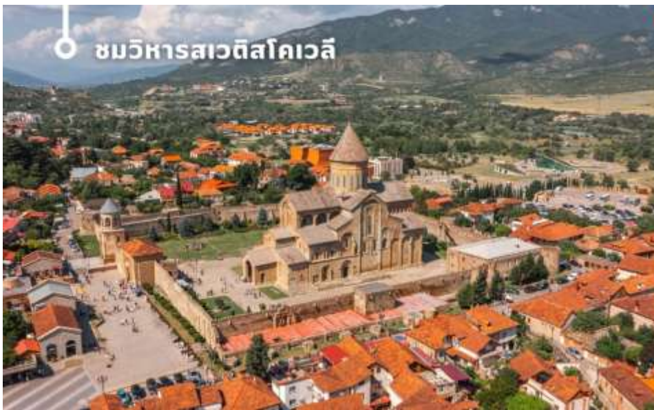
ชมวิหารสเวตส์โคเวลี

นำท่านออกเดินทางชม วิหารสเวตส์โคเวลี (Svetitskhoveli Cathedral) โบสถ์เก่าแก่ที่ถือเป็นศูนย์กลางทางศาสนาอันศักดิ์สิทธิ์ที่สุดของจอร์เจีย มีขนาดใหญ่เป็นอันดับสองของประเทศ และเป็นศูนย์รวมจิตใจของชาวคริสต์ออร์ทอดอกซ์สร้างขึ้นในราวศตวรรษที่ 11 ตัวโบสถ์มีสถาปัตยกรรมที่งดงามตามแบบฉบับของจอร์เจีย โดมสูงเด่นตระหง่าน บ่งบอกถึงความยิ่งใหญ่และศักดิ์สิทธิ์ ภายในวิหารประดับประดาด้วยภาพเขียนฝาผนังที่งดงามเล่าเรื่องราวทางศาสนา และยังมีหอคอยสูงที่สามารถมองเห็นวิวเมืองมซเคตาได้อย่างสวยงาม