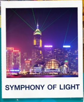
SYMPHONY OF LIGHT