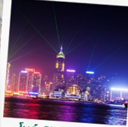
โชว์ SYMPHONY OF LIGHT